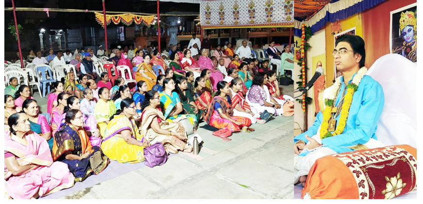
सातारा येथील श्री उत्तरने चिंदंबरम नटराज मंदिरात श्रीमद् भागवत कथा सप्ताहाला मोठ्या उत्साहात प्रारंभ झाला.

येथील श्री उत्तर चिंदंबरम नटराज मंदिरात श्री नटराज महिला मंडळाचे वतीने दिनांक ३ फेब्रुवारी ते ९ फेब्रुवारी दरम्यान आयोजित केलेल्या श्रीमद् भागवत कथा सप्ताहा सोहळ्याला मोठ्या उत्साहात प्रारंभ झाला.