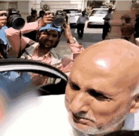
महणत आहे. लोहिया आणि आंबेडकर यांच्या दृष्टिकोनातून मी वाचले. आजचा शूद्र सुशिक्षित आहे. त्याला फसवता येत नाही. शिक्षणमंत्र्यांनी मोबाईल काढून ही ओळ वाचली आणि उलट पत्रकारांनाच विचारले की, यावर त्यांचे काय म्हणणे