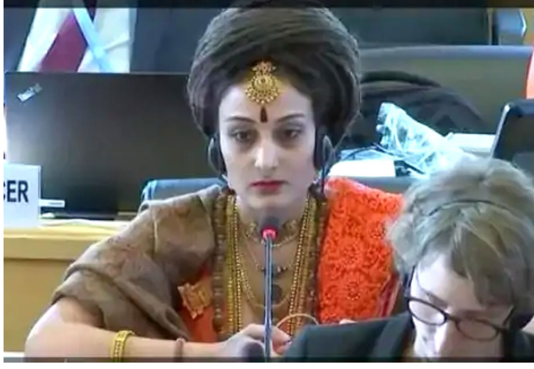
असे त्याचे वर्णन करण्यात आले आहे. २०१९ मध्ये भारतातून फरार झाला होता नित्यानंद