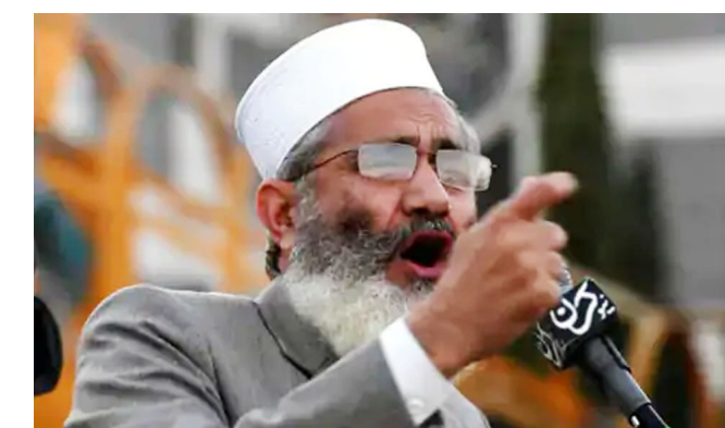
इस्लामाबादमध्ये पत्रकार परिषदेदरम्यान जमियतचे प्रमुख म्हणाले की, केवळ १८ पाकिस्तानी देशाला दिवाळखोरीपासून वाचवू शकतात. त्यांच्या विविध बँकांमध्ये सुमारे ४ हजार अब्ज रुपये जमा आहेत. हक पुढे म्हणाले की, माझ्याकडे या सर्व लोकांची यादी आहे. यामध्ये राजकारणी, लष्करी अधिकारी, न्यायाधीश आणि नोकरशाहा यांचा समावेश आहे. आता या लोकांनी देशासाठी बलिदान देण्याची, त्यांच्या खात्यातून पैसे काढण्याची आणि देशाची अर्थव्यवस्था सुधारण्यासाठी गुंतवणूक करण्याची वेळ आली आहे.

इस्लामाबाद : वृत्तसंस्था पाकिस्तानातील सर्वात मोठा राजकीय आणि धार्मिक पक्ष जमियत-ए-इस्लामीचे प्रमुख सिराज-उल-हक यांच्या मते, देशातील १८ लोकांच्या बँकांमध्ये ४ हजार अब्ज रुपये जमा आहेत. या लोकांच्या नावांची संपूर्ण यादी आपल्याकडे असल्याचा दावा हक यांनी केला. पाकिस्तान दिवाळखोरीच्या उंबरठ्यावर असून हे लोक हवे असल्यास देशाला दिवाळखोरीपासून वाचवू शकतात, असेही ते म्हणाले.