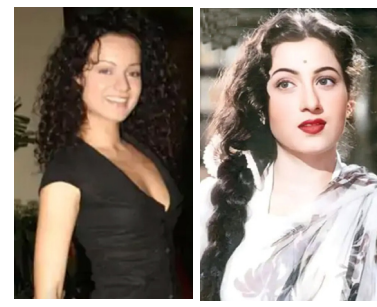
'तारुपेयाच्या दिवसांत मा मधुबालासारखी दिसायचे'