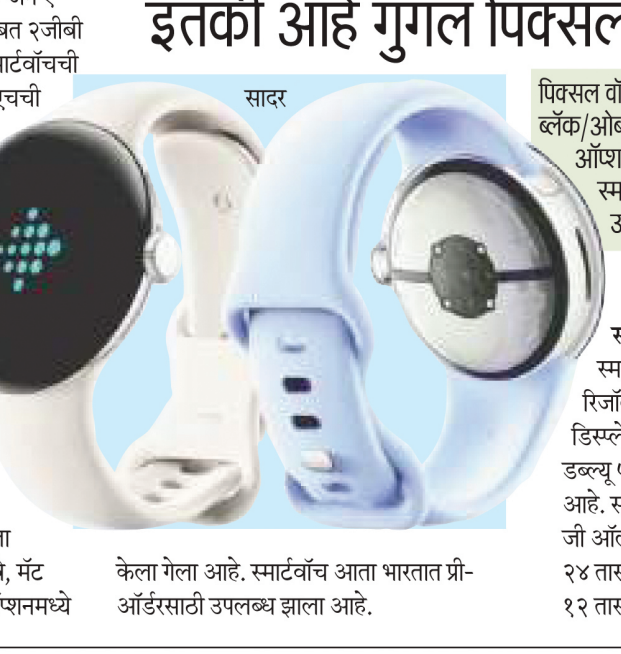
केला गेला आहे. स्मार्टवॉच आता भारतात प्री-ऑर्डरसाठी उपलब्ध झाला आहे.