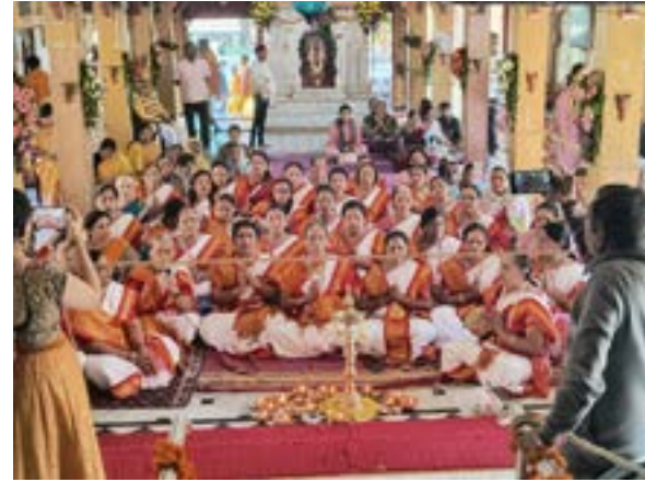
समर्थ सेवा मंडळाच्या वतीने श्रीधर कोटी व भक्तनिवास येथे विविध अध्यात्मिक कार्यक्रम वाचन उपासना करण्यात आली.

संपन्न झाले. सकाळी साडेसात वाजता श्रीराम व श्री समर्थ समाधीची महापूजा रामदासी मंडळींच्या हस्ते करण्यात आली यावेळी पंचसूक्त पवमान पठण करण्यात आले श्रीराम व श्री हनुमान खोत्र सातारा येथील ( पीएचडी नारायणी समूह ) यांच्या