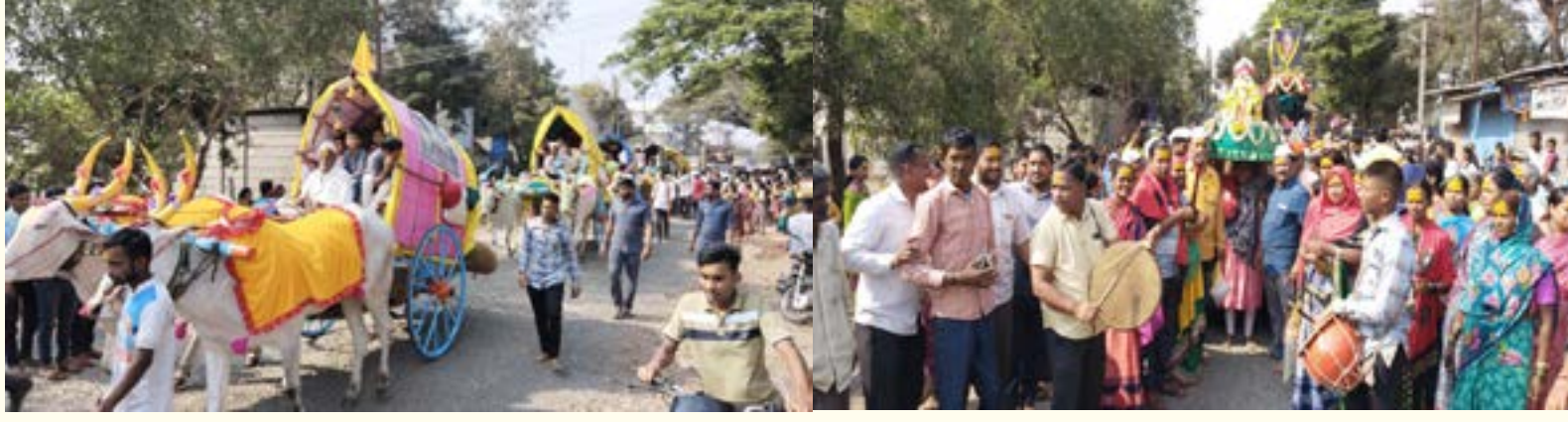
कर्नाटक राज्यातील सौंदत्ती यात्रेला रवाना झालेली यल्लमा मंदिरातील मिरवणुकीने निघालेली रेणुकादेवीची पालखी व बैलगाड्या भक्तगण.

राज्यातील सौंदत्ती येथे होणाऱ्या रेणुका देवीच्या यात्रेसाठी येथील यल्लमा देवालयामातून फुलांनी सजविलेला देवीची पालखी मिरवणुकीने सोमवारी रवाना झाली