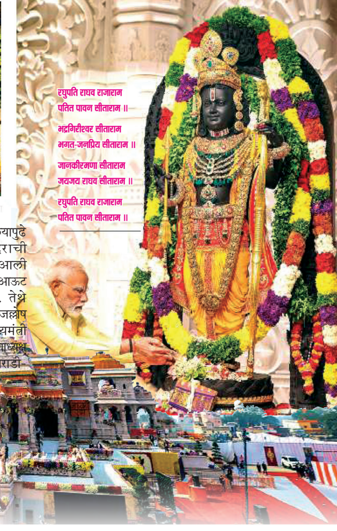
रघुपति राघव टाडाराम पतित पावन सीताराम ॥

प्रदेश भाजपा कार्यालयापुढे अयोध्येतील राममंदिराची प्रतिकृती उभारण्यात आली असून श्रीरामांचा भव्य कटआऊट लावण्यात आला आहे. तेथे आज मिठाईवाटप करून जल्लोष करण्यात आला. उपमुख्यमंत्री देवेंद्र फडणवीस आणि प्रदेशप्रधान चंद्रशेखर बावनकुळे हे कोराडी