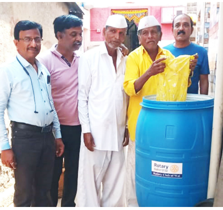
स्वच्छतेचे एक पाऊल पुढे टाकत मेणवली गावात कचरा

वाई रोटररी क्लबच्या सहकार्याने मेणवली सोसायटीने ग्राम परिवर्तनाच्या नांदीला सुरवात करताना ना नफा ना तोटा या तत्वावर बाजार दराच्या तुलनेत कमी दराने सभासदांना शेती कामासाठी ट्रॅक्टर, रोटावेटर,पेरणी यंत्र व मळणी मशीनची सेवा उपलब्ध करून दिली आहे. त्याच बरोबर सोसायटीने स्वच्छतेचे एक पाऊल पुढे टाकत मेणवली गावात कचरा