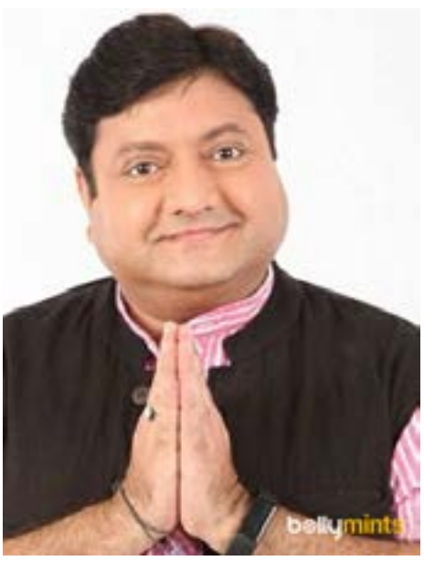
बॉलिवूडचे शहनेशाह अमिताभ बच्चन यांनी सिने कारकिर्दीत अनेक संस्मरणीय चित्रपट