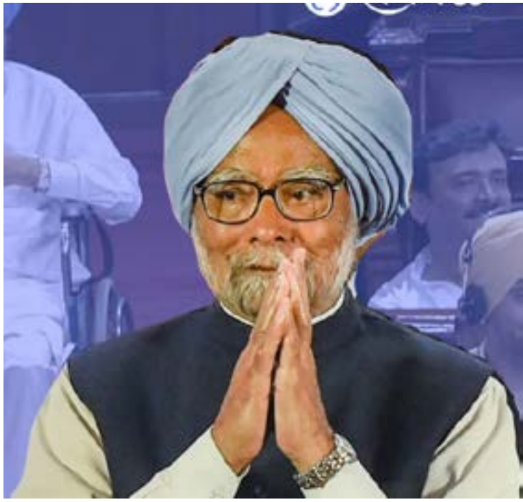
सिंह १९९१ मध्ये पहिल्यांदा राज्यसभेवर पोहोचले होते. सरकारमध्ये मनमोहन सिंग यांनी अर्थमंत्र्याची जबाबदारी सांभाळली होती. या काळातच अर्थव्यवस्थेच्या

राज्यसभेतून निवृत्त होणाऱ्या अनेक खासदारांपैकी अनेकजण लोकसभेची निवडणूक लढणार आहेत, तर काहीजण पुन्हा राज्यसभेवर येतील. मनमोहन सिंग यांनी अर्थव्यवस्थेला दिशा देण्याचे काम केले. त्यांच्या अनेक निर्णयांमुळे भारतीय अर्थव्यवस्थेचे रूप बदलले. मनमोहन