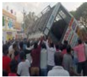
स्टेशन हद्दीतील सालारपूरमध्ये हा अपघात झाला. बसमधील सर्व मुले बाराबंकीच्या सुरतगंज विकास गटातील हरका गावातील आहेत. ही सर्व शाळकरी मुले शिक्षकांसह लखनौला शैक्षणिक सहलीसाठी गेले होते. लखनौहून परतत असताना हा अपघात

उत्तर प्रदेशातील बाराबंकीमध्ये एक धक्कादायक घटना घडली आहे. शाळकरी मुलांनी भरलेली भरधाव स्कूल बस उलटून ४ मुलांसह ५ जणांचा जागीच मृत्यू झाला, तर अनेक मुले गंभीर जखमी झाले आहेत. अपघातानंतर स्थानिकांनी तात्काळ जखमी मुलांना जवळच्या रुग्णालयात दाखल केले. मिळालेल्या माहितीनुसार, ४० मुलांनी भरलेली बस लखनौ प्राणीसंग्रहालयातून परत येत होती.