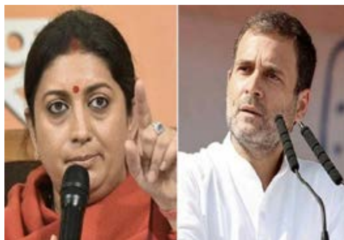
गेली हे कोणीही खोंट ठरवू शकत नाही. कोरोनाच्या काळात मी गावोगावी फिरत होते. मी येथे जातीच्या आधारावर नाही असं देखील स्मृती इराणी यांनी म्हटलं आहे.

राजदंड न्युज नेटवर्क : लोकसभा निवडणुकीच्या तयारीत सर्वच राजकीय पक्ष आपापल्या विरोधी पक्षांना लक्ष्य करत आहेत. याच दरम्यान, अमेठीच्या विद्यमान खासदार आणि केंद्रीय मंत्रीस्मृती इराणीयांनी काँग्रेसवर जोरदार निशाणा साधला. तुम्ही या भागातीलकाँग्रेसचेराजकारण पाहिलं आहे. तुम्ही सर्वांनी गंभीर परिस्थितीत काँग्रेस गायब होताना पाहिली आहे. कोरोना व्हायरस आला तेव्हा काँग्रेस पक्षातील कोणीही लोकांमध्ये दिसलं नाही असंस्मृती इराणीयांनी म्हटलं. अमेठीतील काँग्रेस उमेदवारांच्या घोषणेला होत असलेल्या विलंबाबाबत केंद्रीय मंत्री स्मृती इराणी म्हणाल्या की, यावरून आता काँग्रेस पक्षालाही कळलं आहे की अमेठीने पुन्हा एकदा कमळ फुलवण्याचा निर्णय घेतला आहे. यामागचे कारण म्हणजे जर आपण काँग्रेस पक्षाची ५० वर्षे आणिराहुल गांधींची१५ वर्षे विरुद्ध भाजपा खासदाराची पाच वर्षे पाहा म्हणजे जमीन आसमानाचा फरक दिसेल.जेव्हा देशासमोर कोरोनाचं आव्हान होतं, तेव्हा गांधी घराण्यातील एकही व्यक्ती अमेठीत दिसली नाही. तुमची खासदार गावोगावी