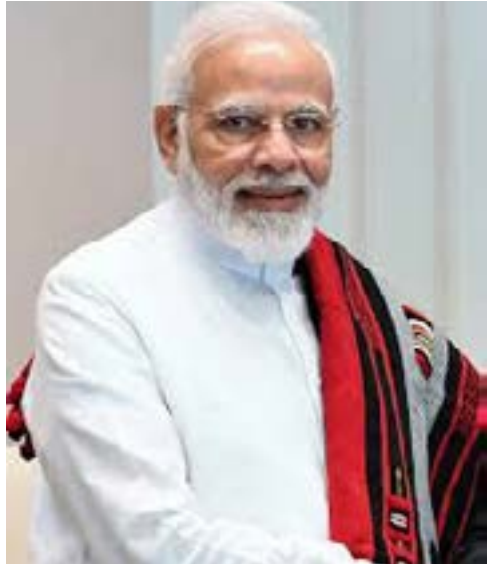
की पुन्हा एकदा मोदी सरकार', असा खोचक टोला पंतप्रधान नरेंद्र मोदी यांनी विरोधकांना लगावला.

दिल्ली : पंतप्रधान नरेंद्र मोदी यांची आज नागपूरच्या कन्हानमध्ये जाहीर सभा पार पडली. ही सभा नागपूर आणि भंडारा-गोंदिया या तीन लोकसभा मतदारसंघासाठी एकत्रित होती. या सभेला मुख्यमंत्री एकनाथ शिंदे, उपमुख्यमंत्री देवेंद्र फडणवीस, केंद्रीय मंत्री नितिन गडकरी, केंद्रीय राज्यमंत्री रामदास आठवले उपस्थित होते. यावेळी पंतप्रधान नरेंद्र मोदी यांनी काँग्रेसवर जोरदार टीका केली. 'इंडिया आघाडीला त्यांच्या पापाची शिक्षा मिळाली पाहिजे', असा हल्लाबोल पंतप्रधान मोदी यांनी केला.