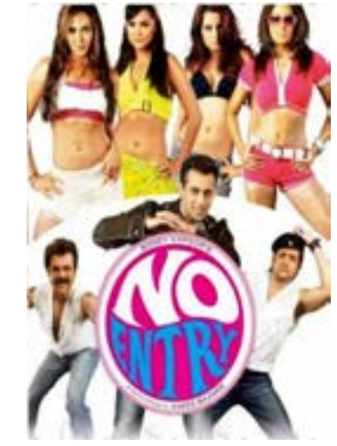
होत्या. या चित्रपटांन बॉक्स ऑफिसवर जबरदस्त कमाई केली होती.