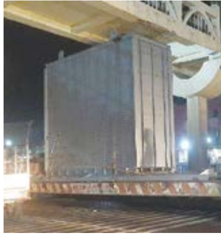
काराड : महामार्गावर पादचारी पुलामध्ये अडकललेला कंटेनर

मुख्यमंत्री आणि पंतप्रधान असताना एकही दिवस सुट्टी न घेता अहोरात्र जनतेची सेवा केली आहे. तर दुसरीकडे राहुल बाबा आहेत. हे दर उन्हाळ्यात परदेशात फिरायला जातात आणि इकडे काँग्रेसवाले सहा महिने त्यांना शोधत बसतात.' एका बाजूला नरेंद्र मोदी आहेत, ज्यांनी २३ वर्षे मुख्यमंत्री आणि पंतप्रधान म्हणून काम केले. २३ वर्षांत