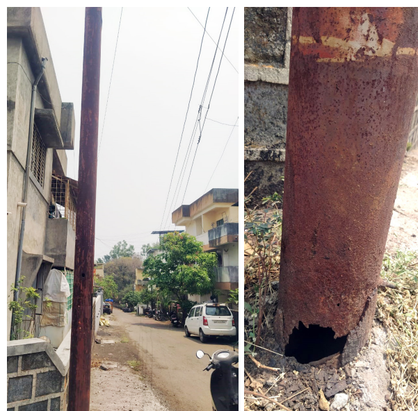
शिवम कॉलनीतील धोकादायक झालेला पोल.

राजदंड / सातारा शिवम कॉलनी गडकर आळी येथील चौकातील मुख्य विद्युत पोल तळातून पूर्णपणे गंजला असून तो निकामी झाला आहे. त्यामुळे हा विद्युत पोल नागरी वस्तीवर कोसळण्याचा धोका निर्माण झाला आहे.