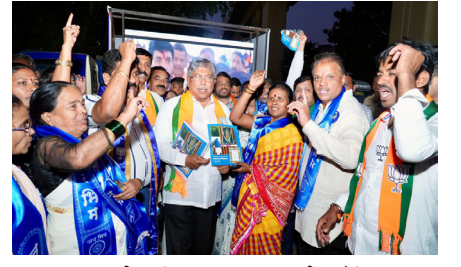
पराभव समोर दिसत असल्याने संविधान बदलण्याची भाषा वृत्त पान ३ वर...