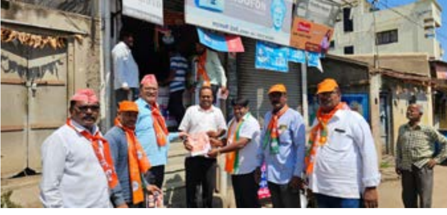
असल्याने नरेंद्र मोदी यांना पुन्हा पंतप्रधान करण्यासाठी महायुतीचे उमेदवार खासदार धैर्यशील माने यांना प्रचंड मताधिक्याने विजयी करावे असे आवाहन भारतीय जनता युवा मोर्चा कोल्हापूर

शिरोळ : सबका साथ सबका विकास ही विचारधारा घेऊन पंतप्रधान नरेंद्र मोदी हे गेली दहा वर्षे देशाच्या प्रगतीसाठी झटत आहेत शेतकरी कष्टकरी आणि सर्वसामान्य जनता केंद्रबिंदू मानून त्यांच्या हिताची धोरण राबवत त्यांचे जीवनमान उंचावण्याचे काम त्यांनी केले आहे त्यांच्या नेतृत्वाखाली खासदार धैर्यशील माने यांनी मतदार संघात विकासाची गंगा आणली यामुळे हजारो कोटी रुपयांची विकास कामे झाली आहेत देशाला सक्षम नेतृत्व हवे