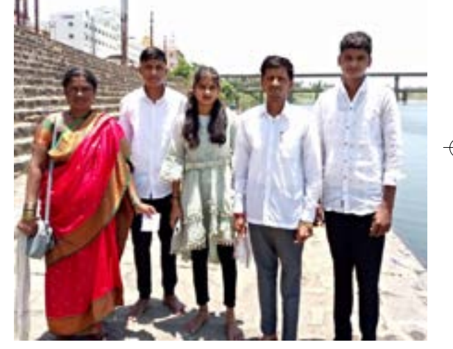
आता जोर धरत आहे.

याबाबत घटनास्थळावरून मिळालेली अधिक माहिती अशी की, अहमदनगर येथून पानेरी कुटुंब दत्त दर्शनासाठी श्रीक्षेत्र नृसिंहवाडी येथे आले होते. दत्त दर्शना अगोदर नदीपात्रात स्नान करण्यासाठी ते कुटुंब गेले, यावेळी नदीपात्रात असलेल्या पायऱ्यावर शेवाळ असल्याने कुटुंबातील सदस्यांचा पाय घसरला एकमेकांना बाहेर काढण्यासाठी कुटुंबातील पाच व्यक्ती नदीपात्रात पडल्याने ते