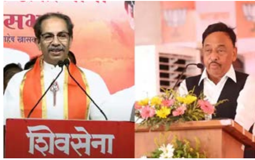
तुमच्यामध्ये हिंमत असेल तर जनतेच्या प्रश्नावर बोला तुमच्यामध्ये हिंमत असेल तर जनतेच्या प्रश्नावर बोला. कोंबडीचोर बरोबर घेतलाय तरी अंडी काही बाहेर येत नाहीयेत, त्यावर बोला.

रत्नागिरी-सिंधुदुर्ग : आज मी कोकणात येणार म्हटल्यानंतर कोणीतरी मला धमकी दिली. मराठीत एक म्हण आहे. त्या म्हणी मी केल्या नाहीत किंवा तुम्ही केल्या नाहीत. पण एक म्हण अशी आहे की, शुभ बोल रे नाच्या. मी येणार म्हटल्यानंतर कसे येतात बघतो म्हणाला. मी येऊन उभा आहे. तू आडवा येच तुला गाडूनच पुढे जातो. अरे तुला लाज वाटली पाहिजे. दोन तीन वेळेस तुझ्या इकडे येऊन तुला आडवा केला. माझ्या घरात तिकडे उभारला तिकडे साफ करून टाकला. लाज नाही लजा नाही. फक्त बडबडतो, अशी टीका ठाकरे गटाचे प्रमुख उद्धव ठाकरे यांनी भाजपचे उमेदवार नारायण राणे (छत्रीरूप टपश) यांच्यावर केली. महाविकास आघाडीचे उमेदवार विनायक राऊत यांच्या प्रचारार्थ ठाकरेंची कोकणात सभा पार पडली. यावेळी ते बोलत होते. उद्धव ठाकरे यांनी यावेळी बोलताना नारायण राणे (छत्रीरूप टपश) यांच्यावर कडाडून हल्लाबोल केला.