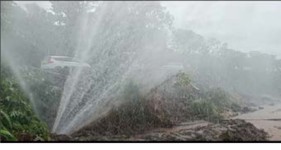
३ किलो-मीटर अंतरावर केले जाते ९० एचपी मोटरच्या शहरात पाणीपुरवठा होतो.गुरुवार जलवाहिनीने पाणी वितरण साह्याने आठ इंच पाईपलाईन द्वारे (दि.१३) रोजी कापूनहोळ-भोर

भाटधर जलाशयातून परिसरातील आठ गावांना तसेच भोर शहराला पिण्याच्या पाण्याचा पुरवठा केला जातो.भाटधर धरणापासून भोर शहराकडे