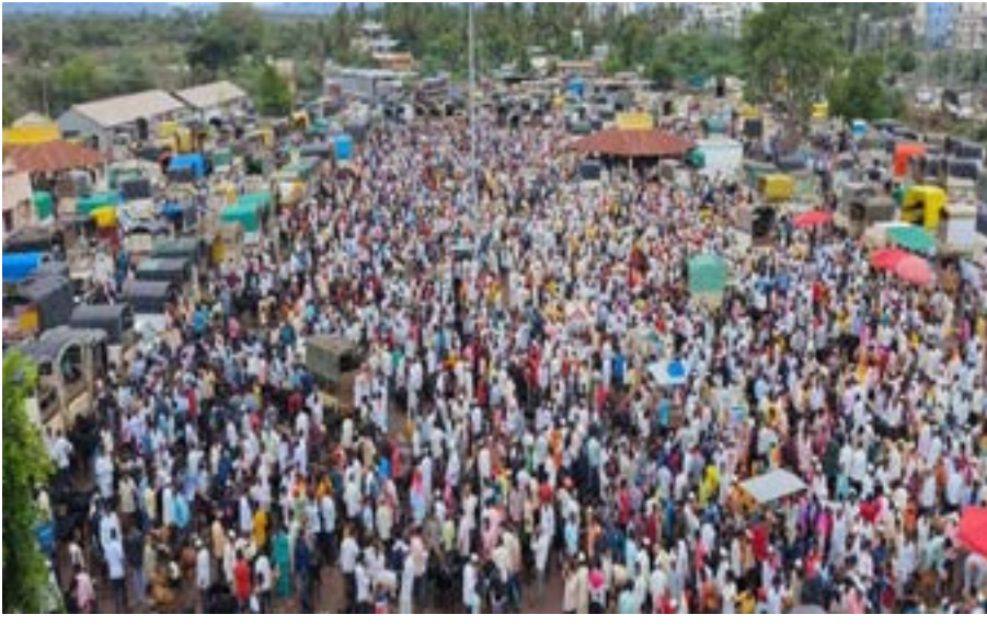
बकरी ईदच्या पार्श्वभूमीवर लोणंद बाजारात बोकड व बकरीची मोठ्या प्रमाणात खरेदी-विक्री, कोट्यावधी रुपयांची विक्रमी उलाढाल

लोणंद बाजार समितीच्या बकरी व बोकड, जनावरे गुरुवारच्या बाजारात गर्दीच गर्दी झाली होती. पहाटे पाचपासून बाजार आवारावर दुचाकी, चार चाकी, व ट्रकमधून शेळी, मेंढी, बकरी व बोकड आवक विक्रीसाठी येत होती. त्यामुळे आजच्या बाजारात बकरी व बोकडांची सुमारे पाच, दहा, पंधरा ते वीस हजार,