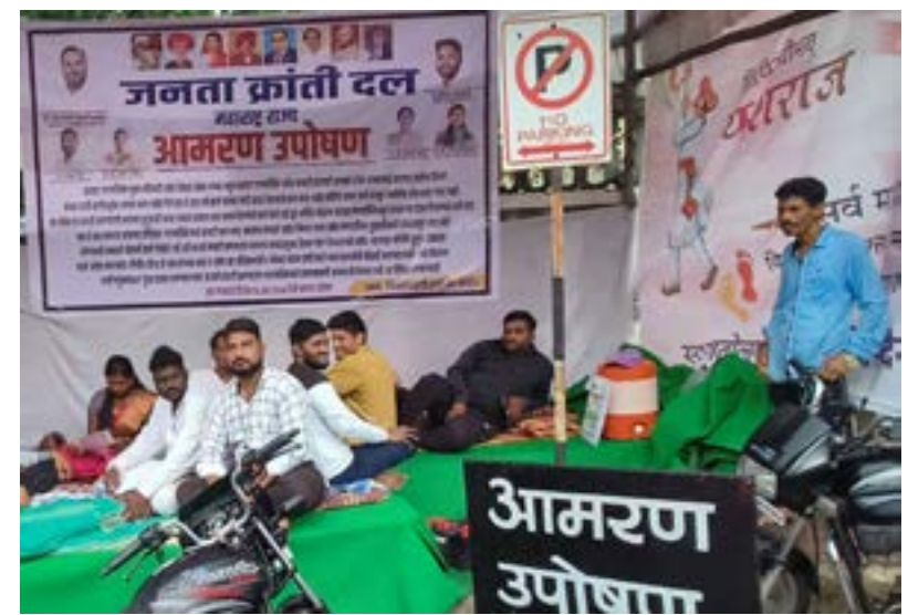
सातारा जिल्हाधिकारी कार्यालयात न्यायालयाच्या प्रतीक्षेत बसलेले आंदोलन व घंटगाडी कामगार

केले जात आहे. असे आरोप ही श्री सोनावले दखल घेतली नाही तर सातार्यातील सर्व कंत्राटी घंटगाडी कामगार हे कचरा संकलित करून सातारा जिल्हाधिकारी कार्यालयात टाकतील. असा इशारा देण्यात आलेला आहे.