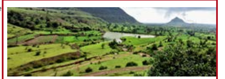
हिरवा निसर्ग हा भवतीने... अशा सुंदर मराठी गाण्याच्या ओळी हे दृश्य पाहिल्यावर ओठावर येतात. नुकत्याच पडलेल्या पावसाचे नयनरम्य दृश्य.