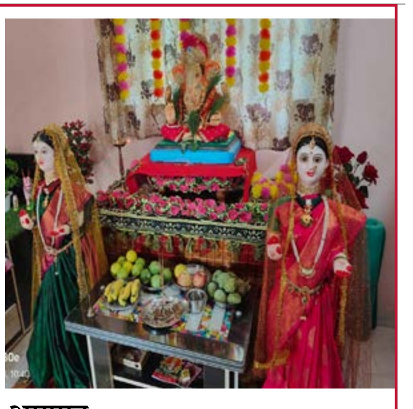
ज्येष्ठा आणि कनिष्ठा गौरींचे उत्साहात आगमन.